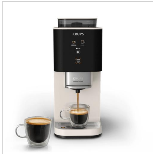
Coffee Crush, Machine à café à grains, ultra compacte Coffee Crush, Machine à café à grains, ultra compacte SA4001E0